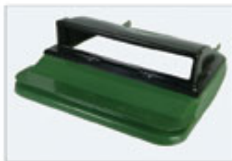
Θυρίδα ανακύκλωσης χαρτιού