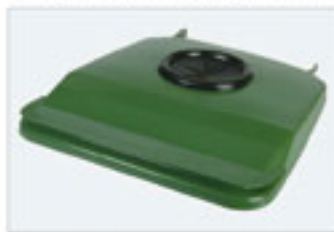
Θυρίδα ανακύκλωσης γυαλιού

Τα καπάκια προσφέρονται με ποικίλες λύσεις ανοιγμάτων. Τυποποιημένες ή εξειδικευμένες θυρίδες που ικανοποιούν όλες τις ανάγκες δίνουν λύσεις για τη συλλογή υλικών όπως αλουμίνιο, γυαλί, χαρτί, κ.λπ.